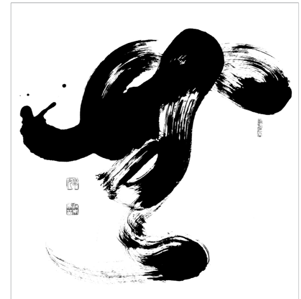
Mu - nichts (Kalligrafie von Sanae Sakamoto)